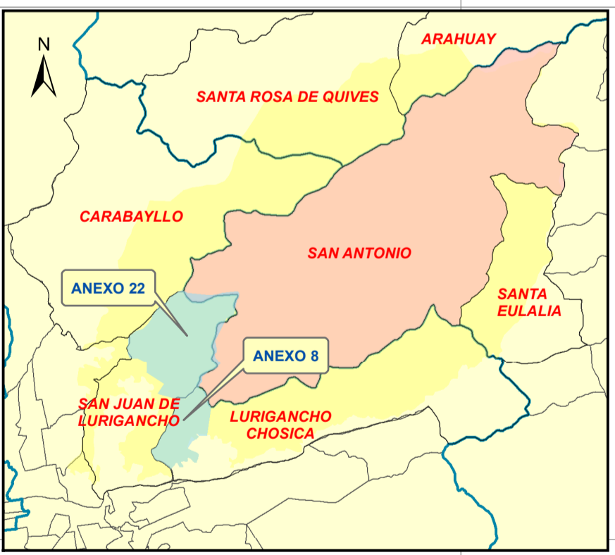
MAPA DE UBICACIÓN Escala : 1 / 500,000

DOCUMENTO SIN VALOR OFICIAL PARA FINES DE DEMARCACION TERRITORIAL